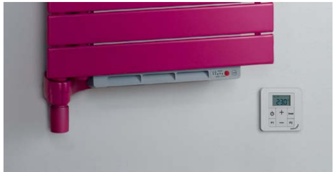
Elektrischer Heizlüfter mit Timerfunktion und Infrarot-Steuergerät